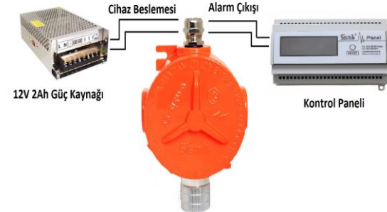
Gasis-Ex01 Endüstriyel Alarm Cihazı